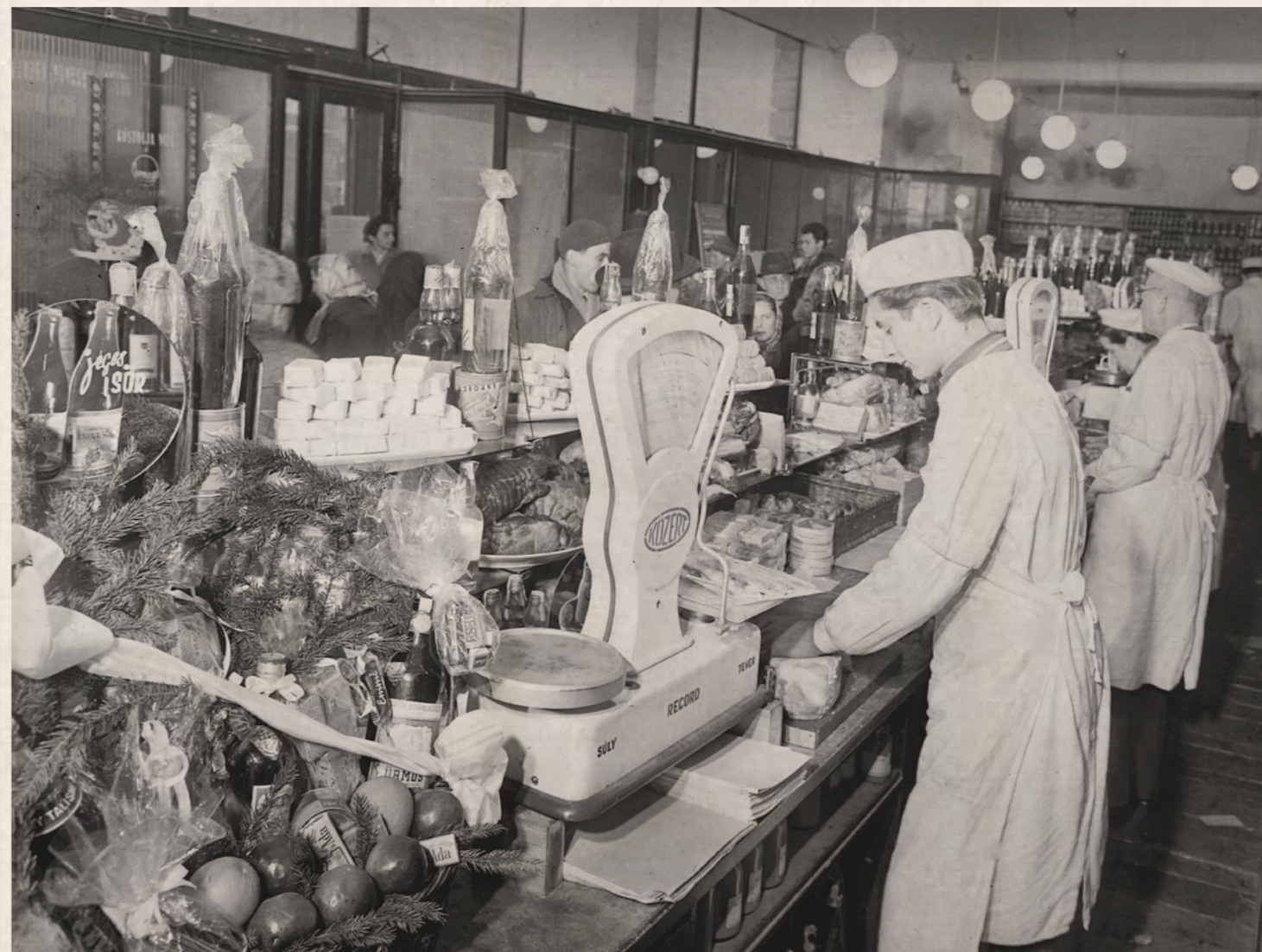
KÖZÉRT az 1950-es években.

Nem mindig volt meg az egyetértés a KÖZÉRT vállalat dolgozói és az ellenőrök között. Ennek általában három oka volt. Az ellenőrök sokszor saját szakállukra cselekedtek, utasították a KÖZÉRT vezetőit, hogyan végezzék a munkájukat, az is előfordult, hogy az áruhalmozást elkerülendő már délelőtt kiosztatták a délutáni műszaknak szánt árut, vagy volt olyan ellenőr is, aki sorszámot akart osztani a sorban állóknak, az egyik ellenőr pedig meg akarta fordítani a sort, hogy „az utolsókból legyenek az elsők”. Másrészt a tanács és az MNDSZ is adott ki igazolványokat, és utóbbiak nem a tanácstól kapták az irányelveket, így nem az aktívának tartott feladatok szerint jártak el, sőt össze is vitatkoztak, hogy kinek a hatáskörébe tartozik az adott üzlet, illetve kinek az igazolványa a „jobb”. Harmadrészt a KÖZÉRT dolgozói udvariatlanok voltak, sokszor rossz mérlegeket használtak, nem írták ki az árakat, vagy túllépték azokat. A Lövölde tér 7. sz. alatti KÖZÉRT üzlet dolgozóira sok panasz érkezett az udvariatlanság miatt, és azért, mert az utalványra kiadandó burgonyát nem mérték le, ha mégis, a dolgozók nem láthatták a mérleg által mutatott értéket.